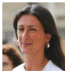
D. Caruana Galizia

Daphne Caruana Galizia wurde vor kurzem in der Nähe ihrer Wohnung auf der Insel Malta durch eine in ihrem Auto versteckte Bombe getötet. Die mutige Journalistin hatte an den „Malta-Files“ gearbeitet, einer Sammlung von 150 000 vertraulichen Dokumenten der maltesischen Finanzbehörde, die zeigen, wie EU-Konzerne und Private über Malta in großem Umfang Steuern hinterziehen. Viele Unternehmen, darunter DAX-Konzerne wie BMW, BASF oder Lufthansa, haben dort Briefkastenfirmen. Wenige Wochen zuvor hatte Daphne C. wegen der Todesdrohungen, die sie erhalten hatte, Anzeige erstattet.