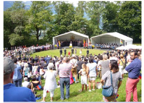
Vaduz/Liechtenstein am Nationalfeiertag 2017 Der Staatsfeiertag in Liechtenstein am 15. August wird von der Fürstenfamilie in einem Staatsakt auf der Schlosswiese gemeinsam mit dem Volk neben dem Schloss Vaduz mit Ansprachen und der Landeshymne „Oben am jungen Rhein“ begangen.