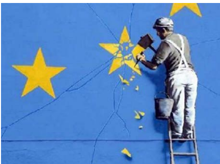
Der Brexit wird von einem englischen Steinmetz auf kunsttechnische Weise sichtbar gemacht.

Wenn ich mir anschau, wie sich Junker & Co. gegenüber den britischen Verhandlern benehmen, dann fällt mir der Chefverhandler der austrittswilligen Grönländer ein. Der Anwalt formulierte damals vor 30 Jahren einen Satz, der heute noch seine hundertprozentige Gültigkeit hat: „Es ist leichter in die EG (jetzt EU) zu kommen, als sie zu verlassen.“ Die Brüsseler Bonzen tun so, als würden die Briten den Gipfelpunkt der Ungehörigkeit, ja vielleicht sogar eine strafbare Unsittlichkeit begehen, indem sie ihre Freiheit zurück-verlangen. Dabei halten sich die Briten, die ich als besonders gesetzestreu kennengelernt habe, als ich mitten unter ihnen lebte und arbeitete, lediglich