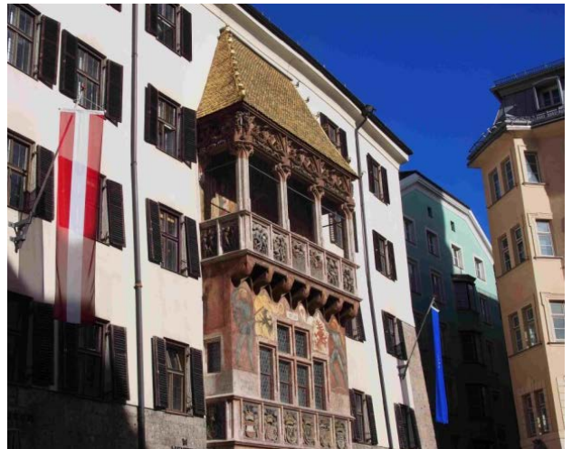
Das Goldene Dachl in der Innsbrucker Altstadt war am Nationalfeiertag festlich beflaggt.

Dass Medien ihre Macht dermaßen einseitig in eine bestimmte Richtung einsetzen können und damit auch noch Erfolg haben, ist ein Skandal ersten Ranges, der an den demokratischen und rechtsstaatlichen Zuständen in Österreich ernsthafte Zweifel aufkommen lässt. Es ist klar, und wir wissen es schon lange, dass vor allem in diesem heiklen Übergangsbereich von Medien und Parteien eine radikale Reform der politischen Kultur in Österreich überfällig ist.